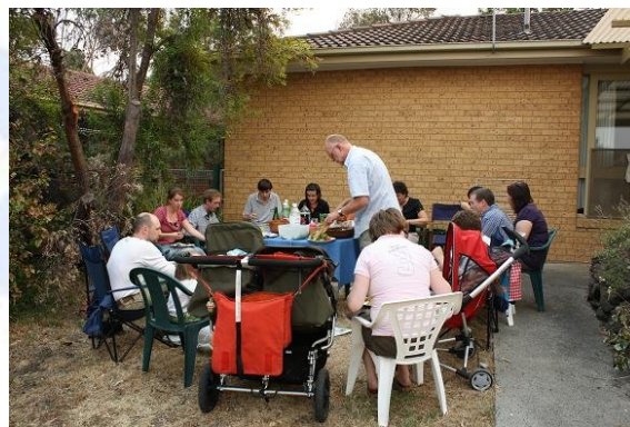
Een BBQ met internationale studenten bij één van de docenten thuis.